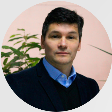
ARTURO FUENTES ESPINOSA RECTOR